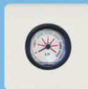
Механический уровнемер +/-10%