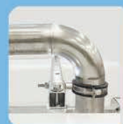
Крепёж & трубопровод из нержавеющей стали