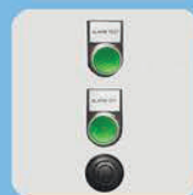
Звуковая и световая сигнализация переполнения