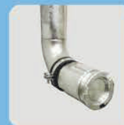
2" быстроразъемное соединение для быстрого и безопасного заполнения