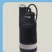
Погружной насос с защитой от сухого хода