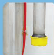
подготовленные электрические кабели и трубопровод для внешних систем учета