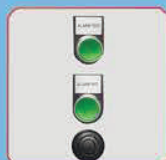
Звуковое и световое предупреждение протечки