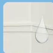
Двухстенный резервуар (2 резервуара)