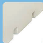
Система обогрева и охлаждения