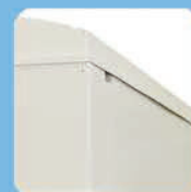
Подвижная крыша для обслуживания