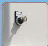
Вкл/выкл клавишный выключатель насоса